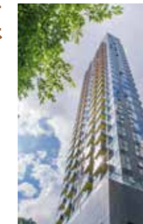
此相片於2014年5月20日在Le Riviera拍攝