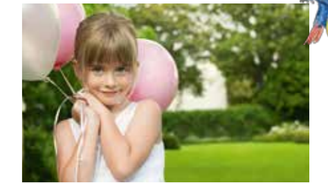
主題花園設計概念圖，並非發展項目現場實景