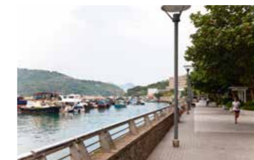
此相片於2014年4月28日在愛秩序灣海濱長廊拍攝