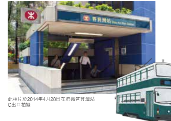
此相片於2014年4月28日在港鐵筲箕灣站C出口拍攝